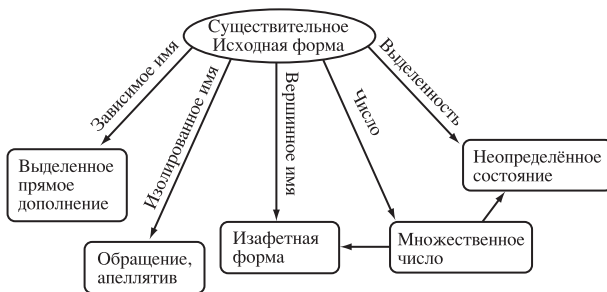
Рис. 1. Векторы изменения форм существительного в персидском, таджикском, дари

Из всех теоретически возможных в языках мира векторах изменения имени в данной работе остановимся на трех (см. Табл. 2): зависимого имени (падеж, склонение), вершинного (изафетная форма, статус) и синтаксически изолированного (вокатив, апеллятив, звательная форма).